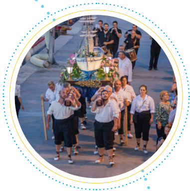
Mare de Déu Blanqueta