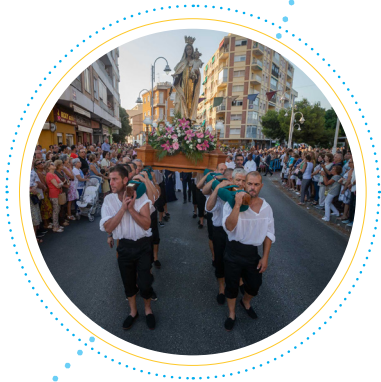
Verge del Carme